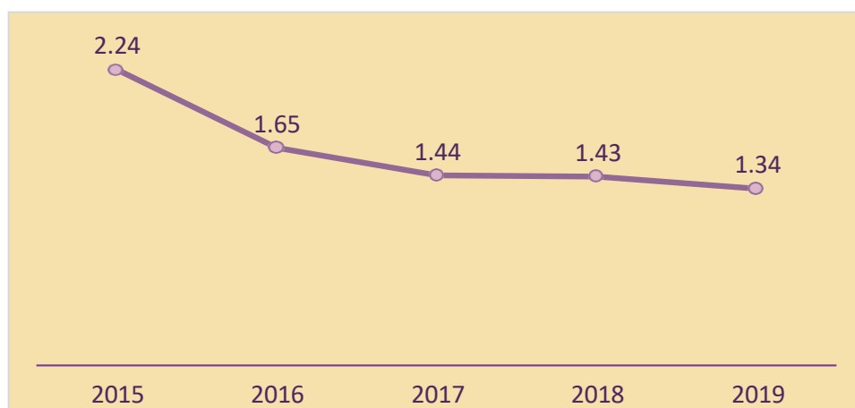
Grafik Laju Pertumbuhan Penduduk Kabupaten Aceh Tamiang

Laju pertumbuhan penduduk Kabupaten Aceh Tamiang tahun 2018 sebesar 1,43 % dan ditahun 2019 turun menjadi 1,34 %. Laju penduduk Aceh Tamiang semakin menurun menunjukkan bahwa kebijakan dalam hal pengendalian pertumbuhan penduduk menunjukkan adanya keberhasilan. Kepadatan penduduk Kabupaten Aceh Tamiang adalah 150,75 per/km 2 . Kecamatan Kota Kualasimpang merupakan kecamatan tertinggi angka kepadatan penduduknya berbanding terbalik dengan luas wilayahnya, sedangkan kepadatan penduduk terendah sebesar 27,14 per/km 2 pada Kecamatan Sekerak dengan luas wilayah jauh lebih besar dari kecamatan Kota Kualasimpang seperti yang dapat dilihat dalam grafik di bawah ini: